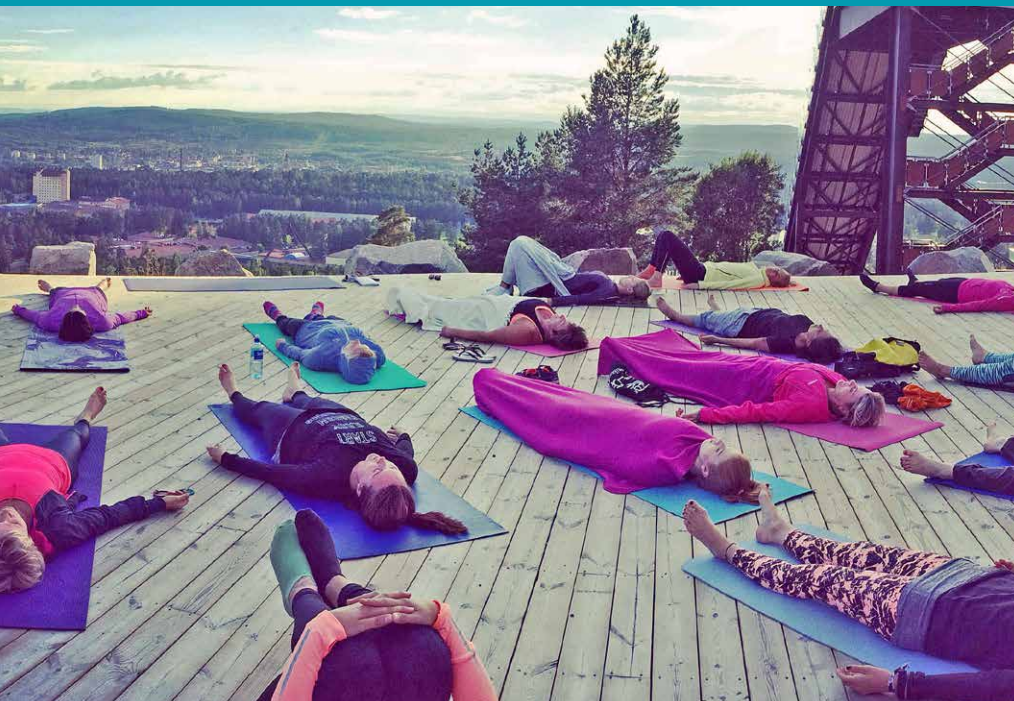
■ Trångt och fullt av yogaintresserade vid Lugnet.